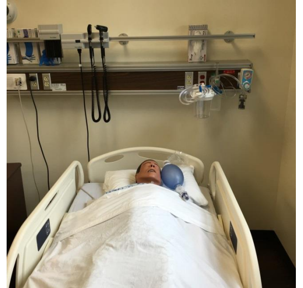
Hasta başı ünitesi