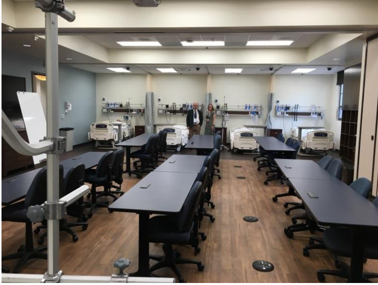
Temel Eğitim Laboratuvarı (San Diego Üniv.Sağ.Bil. Fak./ABD)