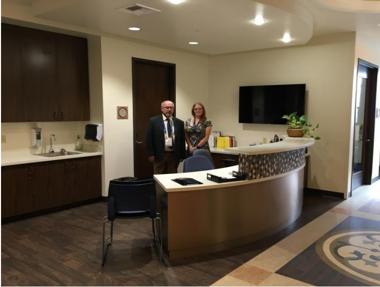
Hemşire Servis Deski